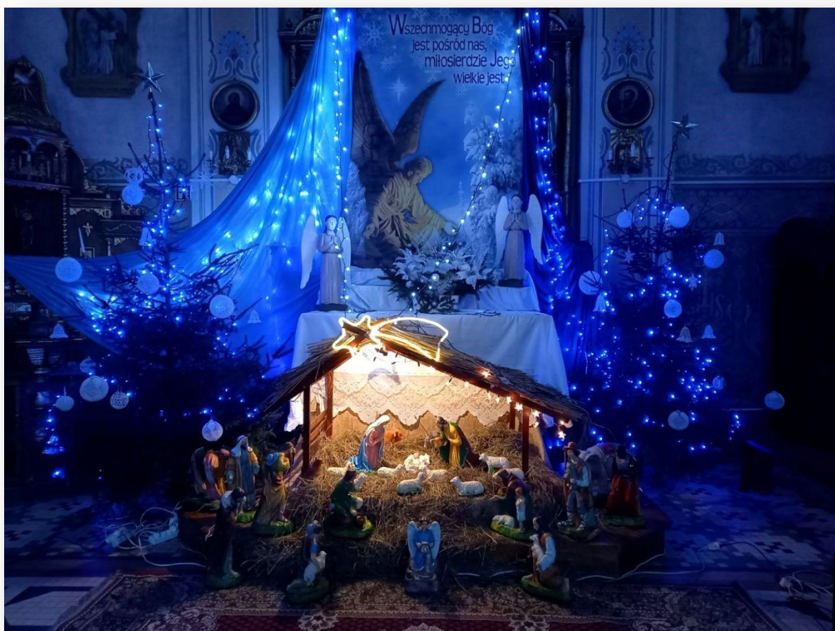
Szopka bożonarodzeniowa w kościele w Łopacinie 2020 r.